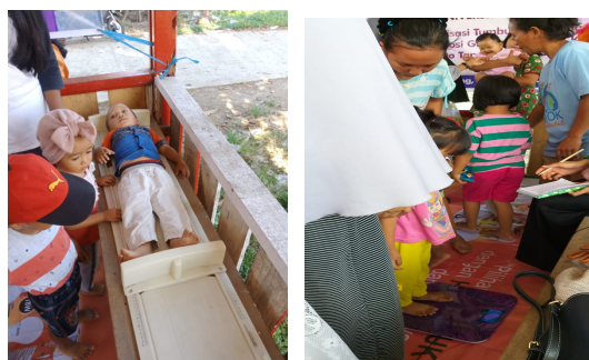
Gambar 5. Pengukuran Panjang Badan dan Berat Badan Balita

dan panjang atau tinggi badan. Penimbangan berat badan menggunakan timbangan digital dan untuk panjang badan menggunakan alat pengukur panjang badan bagi balita yang berusia dibawah 2 tahun atau yang belum bisa berdiri lurus/tegap.