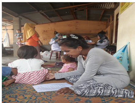
Gambar 3. Kegiatan Pre-test sebelum penyampaian materi penyuluhan d. Penyampaian materi oleh Penyuluh/pemateri dengan menggunakan metoda ceramah menggunakan media leaflet. Leaflet dibagikan kepada anggota posyandu pada saat penyuluhan dan leaflet dikumpulkan kembali pada saat kegiatan post-test . Setelah penyampaian materi, anggota posyandu diberi kesempatan untuk mengajukan pertanyaan. anggota posyandu yang hadir dalam kegiatan ini cukup antusias dan semangat dengan materi yang disampaikan. Hal ini terlihat dari pertanyaan-pertanyaan yang diajukan.