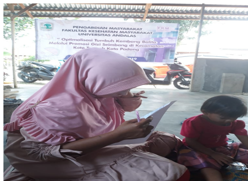
Gambar 6. Kegiatan Post-test setelah penyampaian materi penyuluhan

f. Kegiatan post-test dilakukan setelah penyampaian materi/selesainya sesi tanya jawab. Pada kegiatan post-test ini, sasaran kegiatan pengabdian diminta untuk menjawab kembali pertanyaan-pertanyaan dalam kuesioner mengenai pentingnya gizi seimbang. Pertanyaan pada kuesioner post-test sama dengan pertanyaan pada kuesioner pre-test .