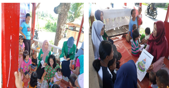
Gambar 4. Penyampaian materi oleh pengabdian e. Penilaian status gizi balita melalui pengukuran/penimbangan berat badan

dan panjang atau tinggi badan. Penimbangan berat badan menggunakan timbangan digital dan untuk panjang badan menggunakan alat pengukur panjang badan bagi balita yang berusia dibawah 2 tahun atau yang belum bisa berdiri lurus/tegap.