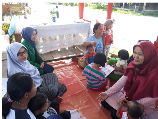
Gambar 2. Penjelasan kegiatan Pengabdian kepada Masyarakat yang akan dilakukan