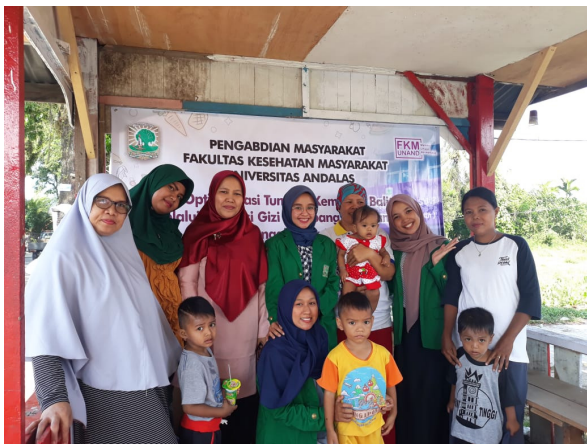
Gambar 9. Pengabdian bersama Ibu Balita dan petugas kesehatan Puskesmas

Beberapa keterbatasan yang ditemukan dalam kegiatan pengabdian antara lain; mencari waktu yang tepat dalam mengadakan kegiatan karena kegiatan ini diselipkan pada kegiatan Posyandu di Puskesmas. Kemudian di satu sisi mengumpulkan sejumlah sasaran agar bisa tenang dan serius dalam mengikuti kegiatan merupakan tantangan tersendiri bagi pengabdian dan anggota pengabdian mengingat jumlah yang berkunjung di Posyandu cukup banyak serta tempat yang kurang memungkinkan untuk bisa berinteraksi dan berkomunikasi lebih baik, disamping tidak semua sasaran yang bersedia mengikuti kegiatan sampai selesai.