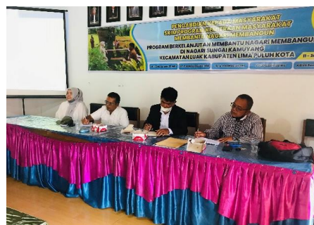
Gambar 3. Pembukaan kegiatan training oleh Wali nagari

Tim LPPM Universitas Andalas saat ini sedang mendampingi ( mentoring ) Tim Manajemen BUMNag menyusun Business Plan (Initial) yang dimaksud hingga akhir bulan November 2021 yang akan datang.