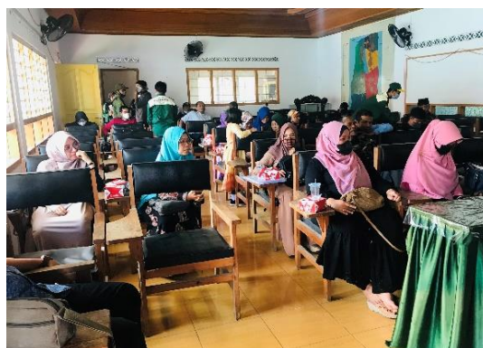
Gambar 4. Peserta Training