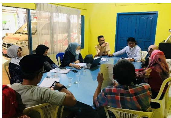
Gambar 5. Kegiatan Mentoring