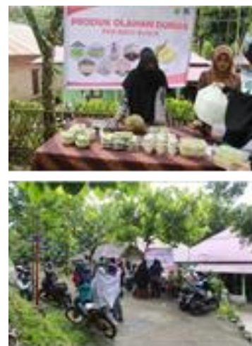
Gambar 2. Penjualan produk olahan durian Kontes Buah Durian

bagi wisatawan. Dengan demikian selain menikmati wisata alam di Batu Busuk, wisatawan juga dapat menikmati durian segar dan berbagai kuliner olahan durian. Potensi wisata seperti ini tidak dimiliki oleh daerah wisata lain di kota Padang, bahkan di Sumatera Barat. Sekarang ini saja, pengunjung sudah datang ke Batu Busuk pada musim durian khusus untuk membeli durian, sehingga di masa mendatang, kuliner durian bisa menjadi tujuan atau atraksi wisata utama yang unik yang menarik kedatangan wisatawan sebagaimana pembelian buah durian. Kemampuan kuliner menjadi atraksi wisata utama dinyatakan oleh [15].