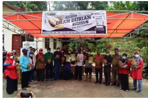
Gambar 4. Pemenang kontes buah durian unggul dan tim abdimas Unand

Pengumuman pemenang dan pemberian hadiah bagi juara dihadiri oleh PU KKN Universitas Andalas, Dekan Fakultas Pertanian Universitas Andalas, dan Dinas Pertanian Kota Padang (Gambar 4).