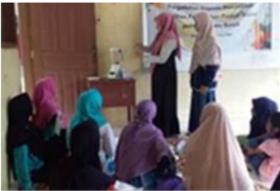
Gambar 1. Penyuluhan, demonstrasi dan pelatihan pengolahan buah durian

Oleh karena itu pengolahan buah durian sangat penting dilakukan terutama pada saat produksi buah durian melimpah di pasaran atau buah-buah yang kondisinya tidak prima sehingga nilai jualnya akan rendah jika dijual segar. Kegiatan penyuluhan, demonstrasi dan pelatihan pembuatan berbagai produk durian menjadi durian beku, es krim, selai, krim, susu kental manis, dodol, tamam, pancake, dan cake durian sebagaimana Gambar 1, pada dasarnya merupakan upaya untuk meningkatkan nilai tambah durian sehingga dapat mendorong berkembangnya UMKM baru di Batu Busuk. Kegiatan pengolahan buah durian ini dapat memanfaatkan buah rusak yang masih layak, hambar atau buah berkualitas rendah lainnya sehingga harga jualnya rendah.