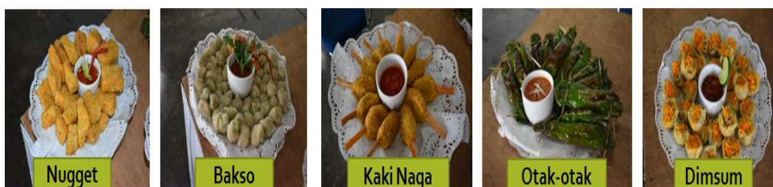
Gambar 6. Hasil praktek pengolahan ikan air tawar menjadi beberapa produk pangan