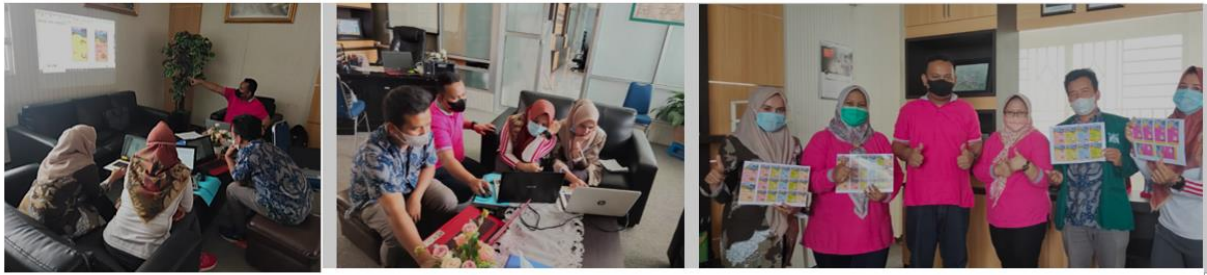
Gambar 9. Praktek pembuatan label