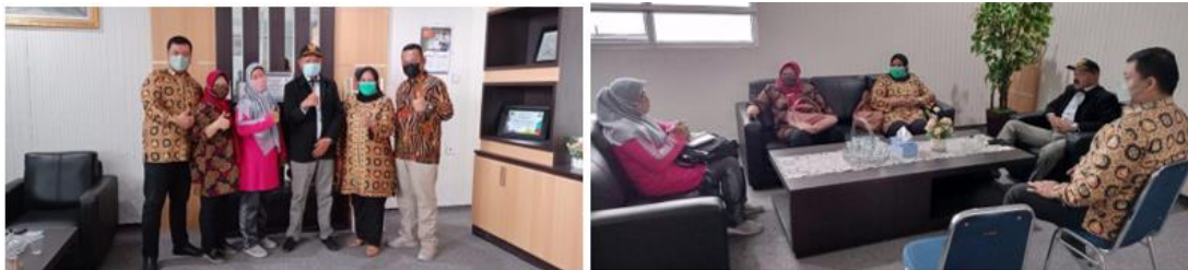
Gambar 1. Sosialisasi kegiatan pengabdian masyarakat bersama Bapak Wali Nagari Alahan Panjang serta perwakilan PKK