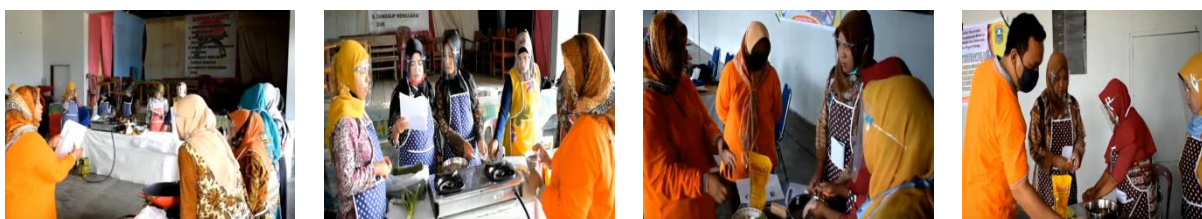
Gambar 4. Penjelasan mengenai teknik pengolahan ikan air tawar