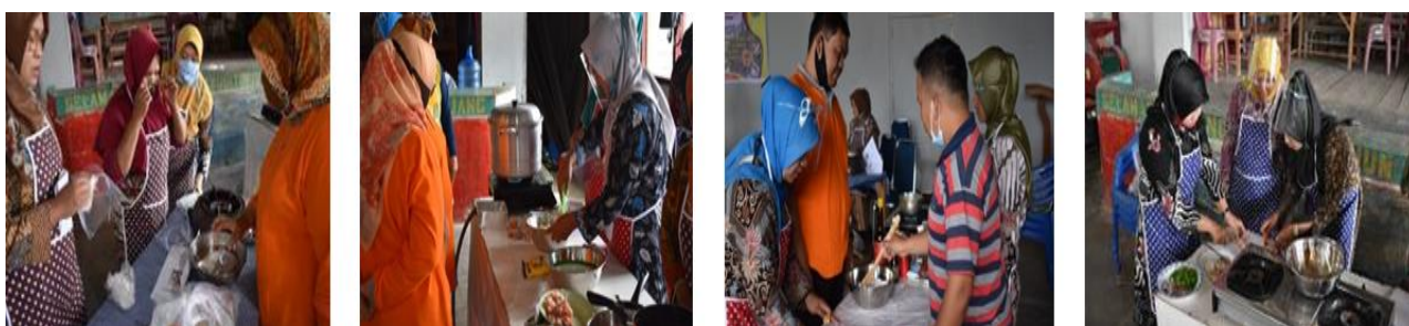
Gambar 5. Peserta pelatihan melaksanakan praktek pembuatan aneka olahan ikan air tawar didampingi oleh instruktur dan tim pengabdian