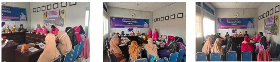
Gambar 2. Pemberian teori mengenai cara produksi pangan yang baik, pengemasan makanan dan manajemen usaha