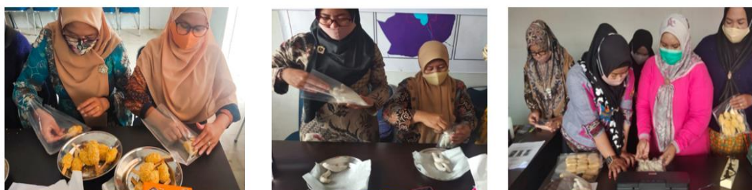
Gambar 7. Praktek pengemasan pangan