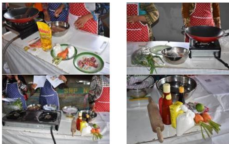
Gambar 3. Peralatan beserta bahan-bahan yang digunakan untuk kegiatan pengabdian masyarakat berbahan dasar ikan air tawar