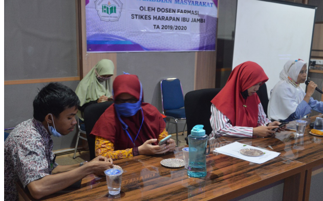
Gambar 3. Foto Kegiatan penyuluhan/sosialisasi tentang sehat dengan obat tradisional dan suplemen kesehatan di masa pandemi