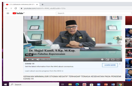
Gambar 1. Dukungan terhadap tenaga kesehatan dan ajakan stop stigma negatif dari Dekan Fakultas Keperawatan Universitas Syiah Kuala