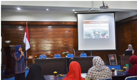
Gambar 2. Penyuluhan tentang darurat sampah di Indonesia

sungai-sungai yang melintasi DIY yang banyak ditemukan diaper bekas pakai. Hal tersebut diperparah dengan adanya mitos yang masih dianut warga Yogyakarta bahwa tidak boleh membakar diaper atau membuangnya ke tempat sampah karena yakin anaknya tersebut akan sakit. Puluhan meter tinggi tumpukan sampah di TPA Piyungan dan ratusan diaper yang terbuang ke sungai merupakan akumulasi gaya hidup masyarakat di sekitar DIY yang tidak ramah lingkungan dan membuang sampahnya tanpa melakukan upaya 3R ( reduce, reuse, recycle ).