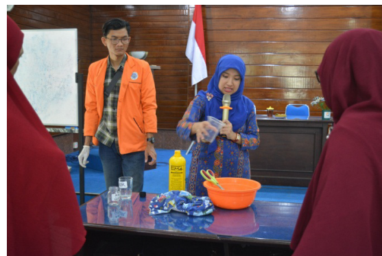
Gambar 3. Pelatihan mengolah diaper bekas menjadi media tanam

ini mampu menjaga kelembaban tanah. [5] telah meneliti bahwa 30,7% komponen diaper mengandung hidrogel super absorben polimer (SAP). Hidrogel SAP kini telah digunakan sebagai bahan penyimpan air dalam jumlah banyak dan waktu yang lama [6], Hidrogel SAP yang dicampur dengan tanah juga mampu menahan laju pelepasan air dan meningkatkan kemampuan perkecambahan biji dan pertumbuhan semai [7], [8]. Selain itu, EM4 dalam pengolahan diaper bekas digunakan untuk meningkatkan kesuburan dan produktivitas tanah [9]. EM4 merupakan media yang mengandung baktri fermentasi dari Genus Lactobacillus dan Saccharomyces yang mampu memfermentasi bahan organik di dalam tanah menjadi unsur-unsur organik. Selain itu, EM4 mengandung bakteri penambat N dan bakteri pelarut P.