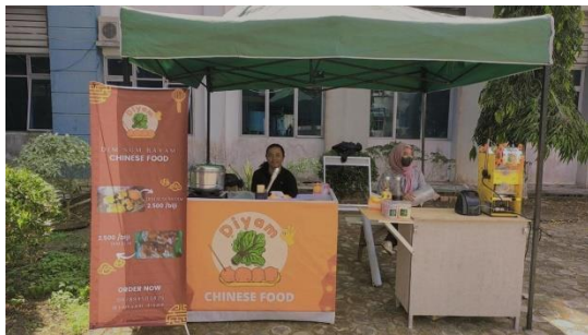
Gambar 5. Stand pemasaran produk Diyum dan Coconut Milkshake di Universitas Jambi Kampus Pondok Meja

Kegiatan pengabdian kepada masyarakat ini meningkatkan pemahaman mitra kelompok usaha mahasiswa terhadap pentingnya CPPB sebesar 28,75% dan sistem jaminan halal sebesar 23,25%. Kelompok usaha telah melakukan pendaftaran P-IRT dan SJH serta telah mendapatkan Nomor Izin Berusaha (NIB) dengan nomor 1608230031157 dan 1608230030257.