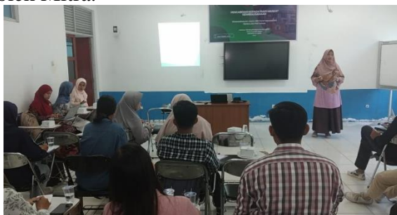
Gambar 3. Proses sosialisasi dan pendampingan penerapan CPPB dan SJH

Oleh karena itu, kegiatan sosialisasi ini memberikan pengenalan dan edukasi mengenai CPPB dan sistem jaminan halal untuk memperoleh sertifikasi halal yang akan menjadi dasar untuk penerapan selanjutnya oleh Mitra.