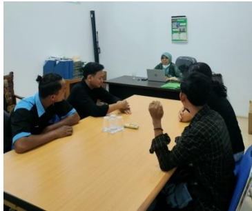
Gambar 1. Kegiatan Koordinasi dan Diskusi dengan kelompok usaha rintisan

Program Studi Teknologi Industri Pertanian. Koordinasi ini bertujuan untuk melihat sejauh apa tim PMW dalam mengembangkan usahanya.