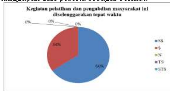
Gambar 11 Hasil kuesioner pernyataan 1: ketepatan waktu pelaksanaan kegiatan

Berdasarkan hasil umpan balik dari kuesioner yang telah diberikan kepada peserta sebagai bentuk evaluasi agar kegiatan pengabdian selanjutnya dapat dilaksanakan dengan lebih baik, maka diperoleh hasil tanggapan dari peserta sebagai berikut: