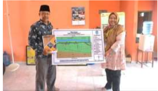
Gambar 7 Penyerahan peta desa dan profil desa