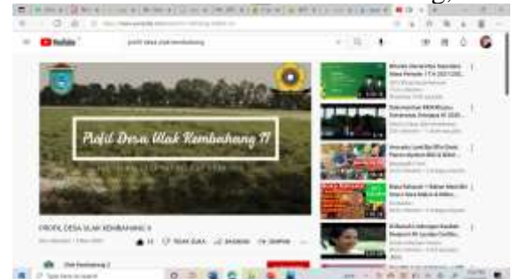
Gambar 9 Video youtube profil Desa Ulak Kembang II