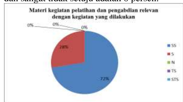
Gambar 12 Hasil kuesioner pernyataan 2: materi kegiatan pelatihan dan pengabdian relevan dengan kegiatan yang dilakukan

Gambar 11 menunjukkan bahwa dalam pelaksanaan kegiatan pelatihan dan pengabdian masyarakat telah diselenggarakan tepat waktu sesuai dengan susunan acara yang telah di rencanakan, hal ini terlihat dari persentase peserta yang memilih sangat setuju yaitu sebesar 66 persen, sedangkan 34 persen lainnya memilih setuju dan untuk kategori netral, tidak setuju dan sangat tidak setuju adalah 0 persen.