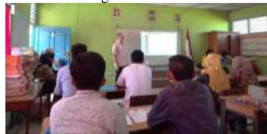
Gambar 2. Pelatihan survey pengumpulan data