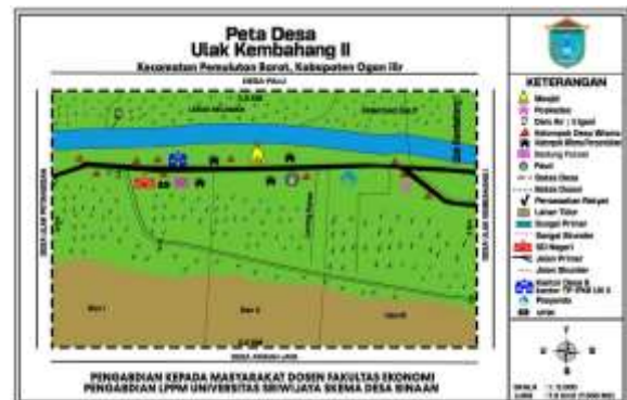
Gambar 8 Peta Desa Ulak Kembang, 2021