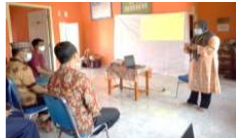
Gambar 1. Kunjungan awal ke desa: FGD identifikasi masalah dan kerangka pemecahan masalah