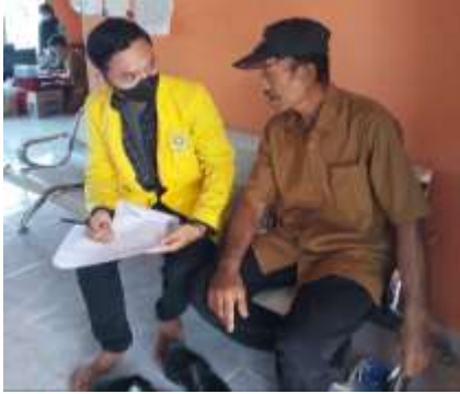
Gambar 4. survey pengumpulan data