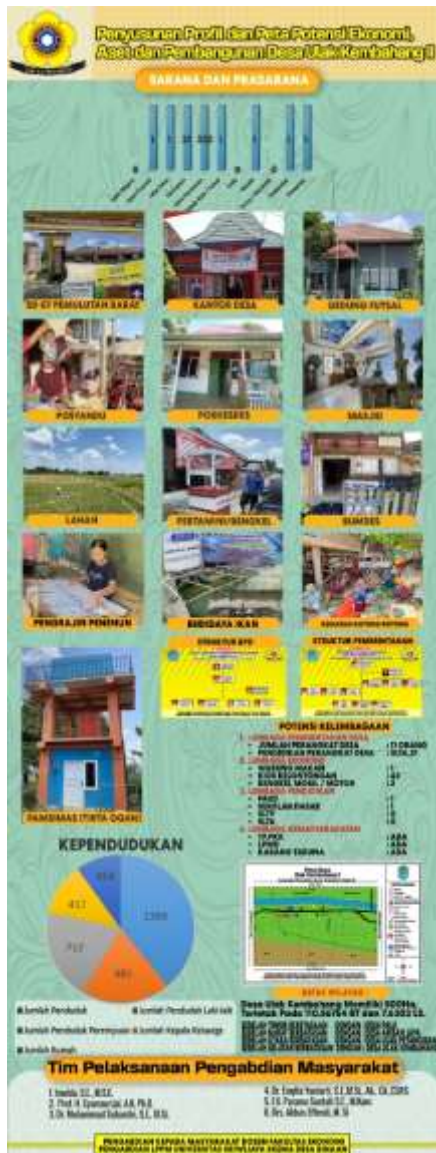
Gambar 10 X-Banner Profil Desa Ulak kembang II, 2021

Setelah pengabdian kepada masyarakat di Desa Ulak Kembang II selesai dilakukan, maka dilakukan evaluasi terkait kegiatan. Adapun evaluasi yang dilakukan berupa penyebaran angket/kuesioner yang terdiri dari evaluasi ke para peserta yang mengikuti pelatihan dan rangkaian kegiatan pengabdian dan evaluasi kepada mahasiswa yang terlibat dalam kegiatan tersebut. Evaluasi kepada peserta terdiri dari dua evaluasi yang dilakukan yaitu yang pertama, terkait dengan evaluasi pendampingan terhadap pengumpulan data, peng-entry-an data, pengolahan data serta penyusunan data. Evaluasi kedua terkait dengan pelatihan pengarsipan dan penyusunan administrasi data. Adapun kriteria dan indikator yang diajukan antara lain terkait dengan bagaimana aparat desa memahami bagaimana pengelolaan administrasi maupun