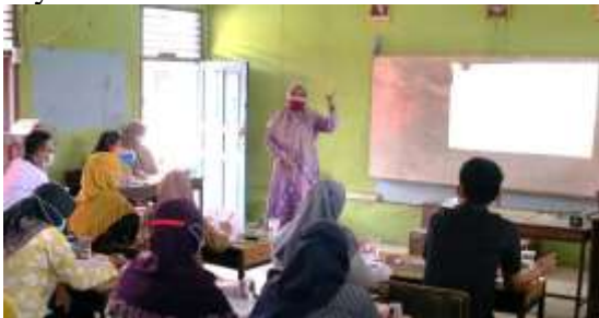
Gambar 5. Penyuluhan dan pelatihan administrasi desa dan pengarsipan