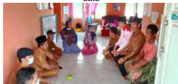
Gambar 3. FGD pembagian tugas pengumpulan data