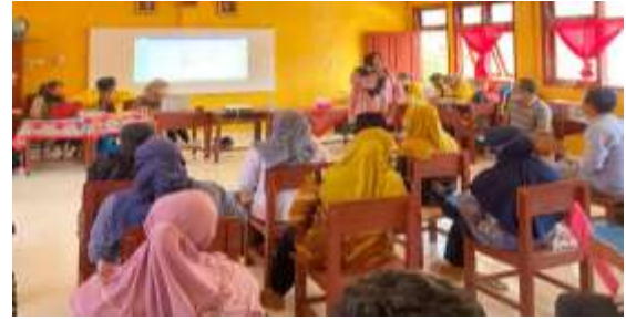
Gambar 6 FGD draft profil desa